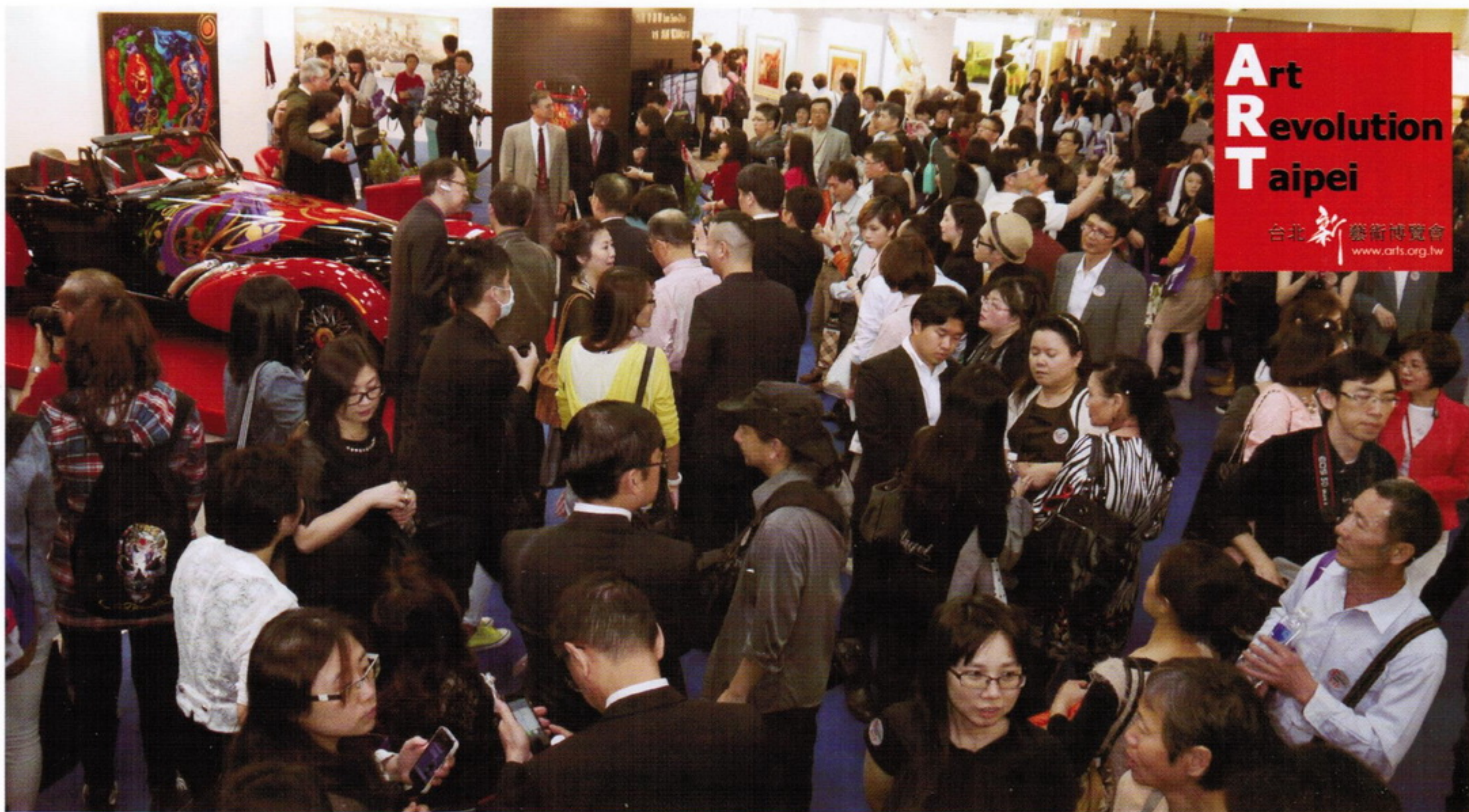
超跑界的愛車人士紛紛現身展場，火熱詢問不曾間斷。