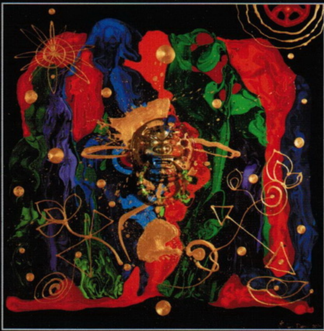
李善單 大將門2014／氣奔大宇 複合媒材 145×145cm