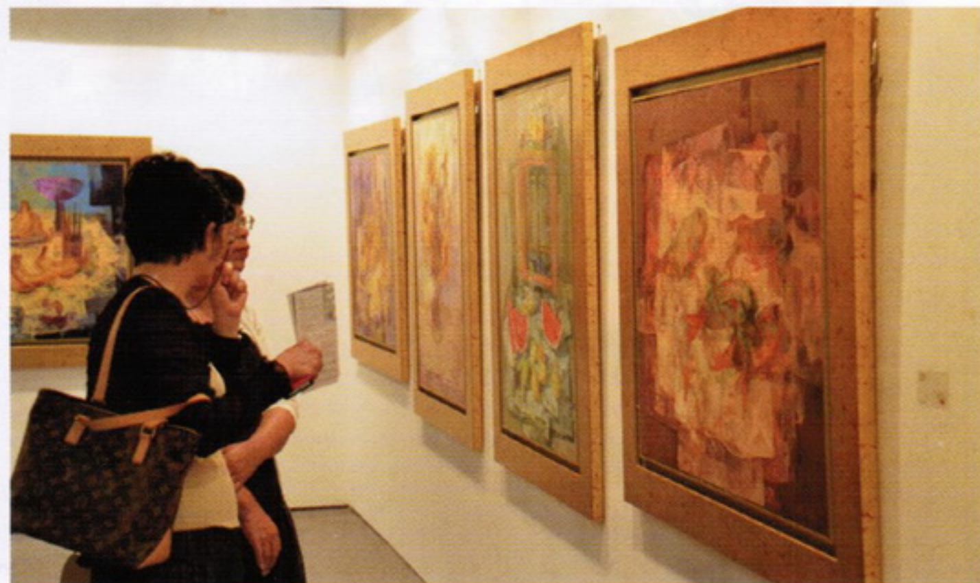
台北新藝術博覽會已成為全亞洲最具指標性的藝博會之一，並在買家心目中也建立起「絕對品牌」。