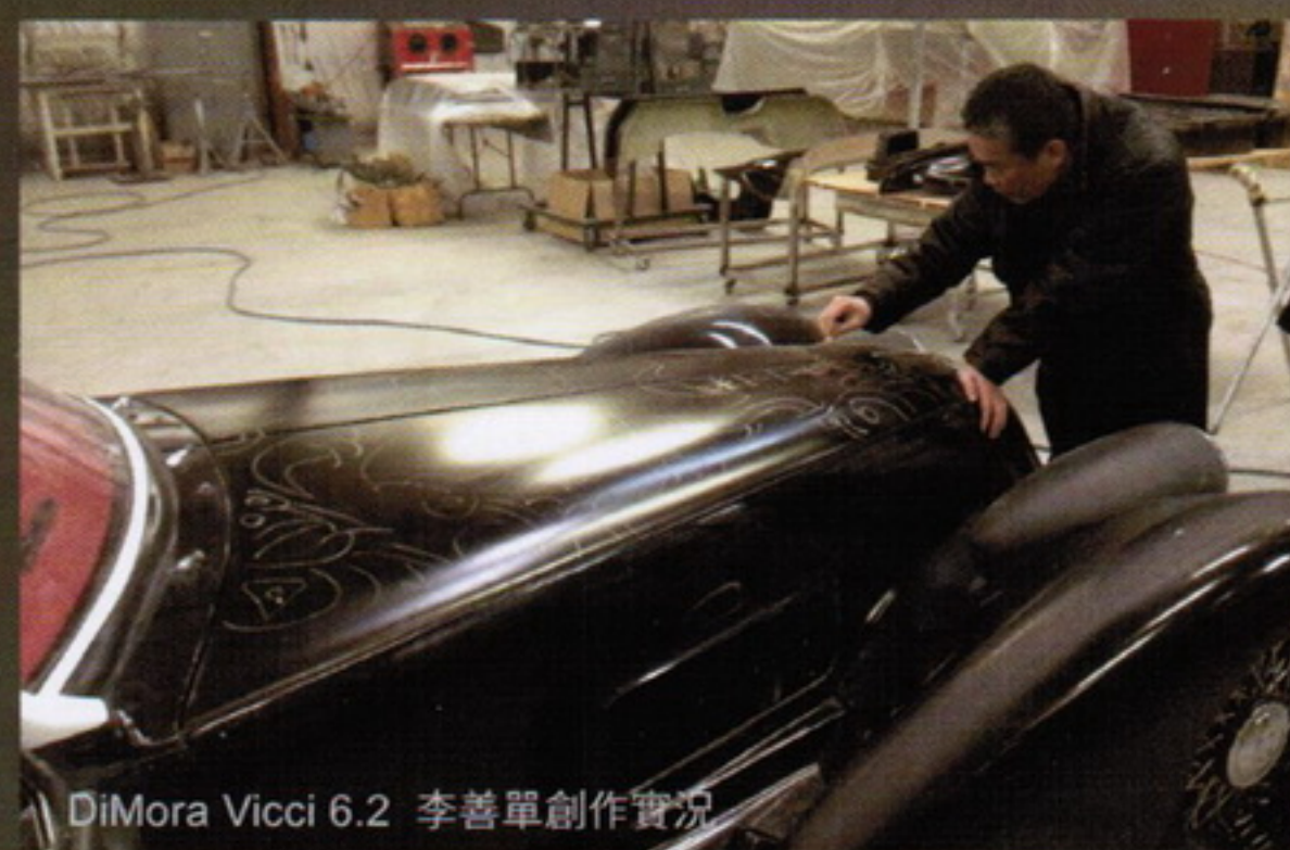
DiMora Vicci 6.2 李善單創作實況