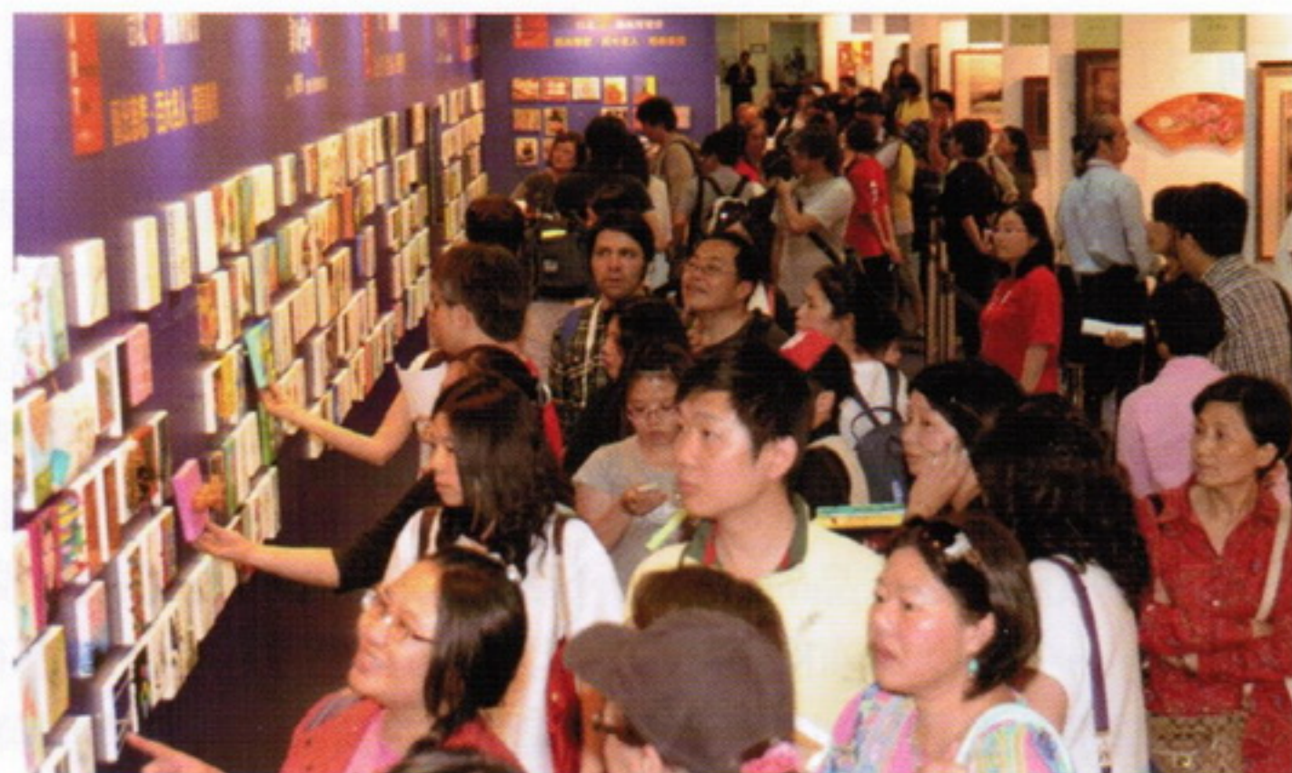
「藝出慈悲·百大名人」攜手獻愛心，義賣當日作品秒殺一空。