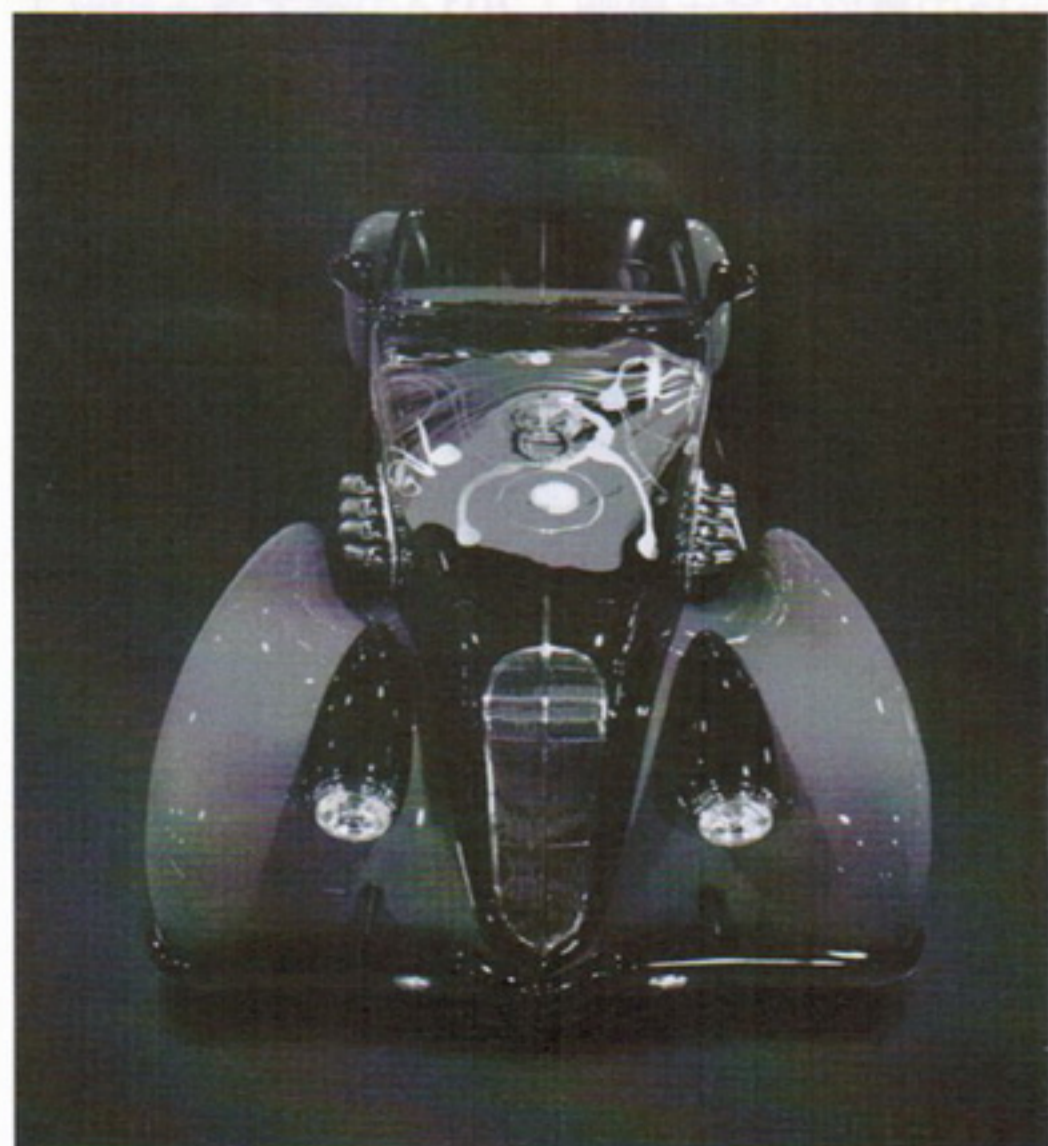
DiMora新古典藝術超跑「Vicci 6.2 帝王I」於2014台北新藝術博覽會展出

這款極致豪華的新古典藝術超跑，不但保有DiMora的經典復古車型，更特別與台灣藝術家李善單跨界合作，於車身上繪製24K金「大將門系列」圖騰能量藝術，整體展現出DiMora手工打造的極致工藝與「新古典」藝術大師風範。