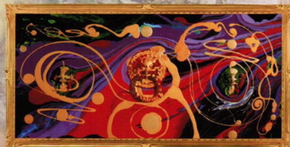
李善單《大將門2014／鴻圖大展》